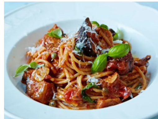
Pasta alla norma