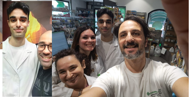
Fotos de despedida con los compañeros y compañeras